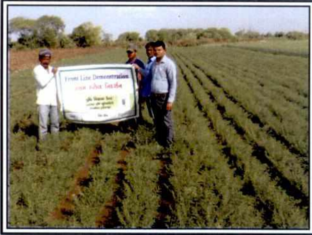
FLD Crop: Chick Pea