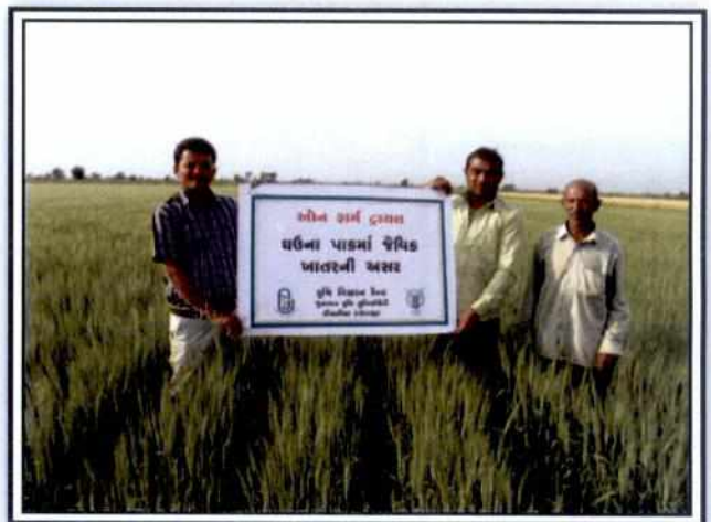
OFT on Wheat