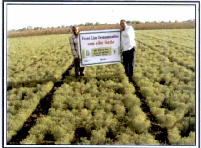
FLD Crop: Cumin