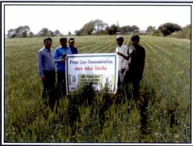
FLD Crop: Wheat