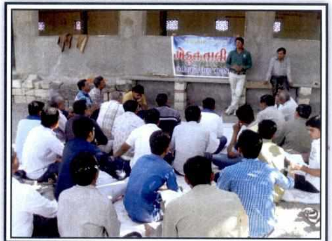
State Agriculture Department-Rajkot